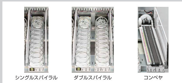
シングルスパイラル